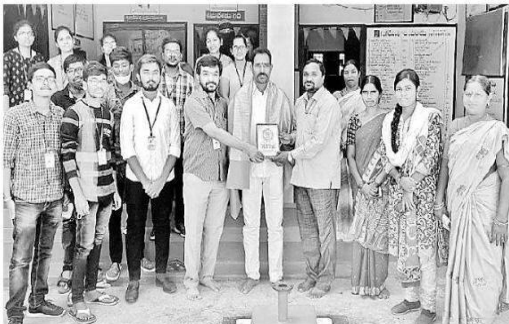
సర్పంచ్‌ను సన్మానించి, మెమెంటోను అందజేస్తున్న కిట్స్ విద్యార్థులు