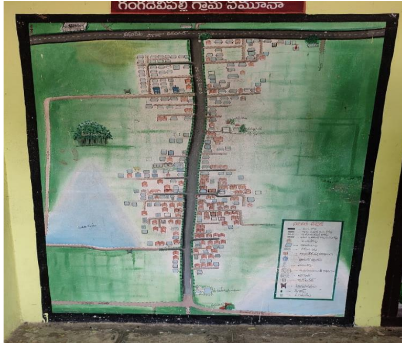
Blue print of Gangadevipalli village